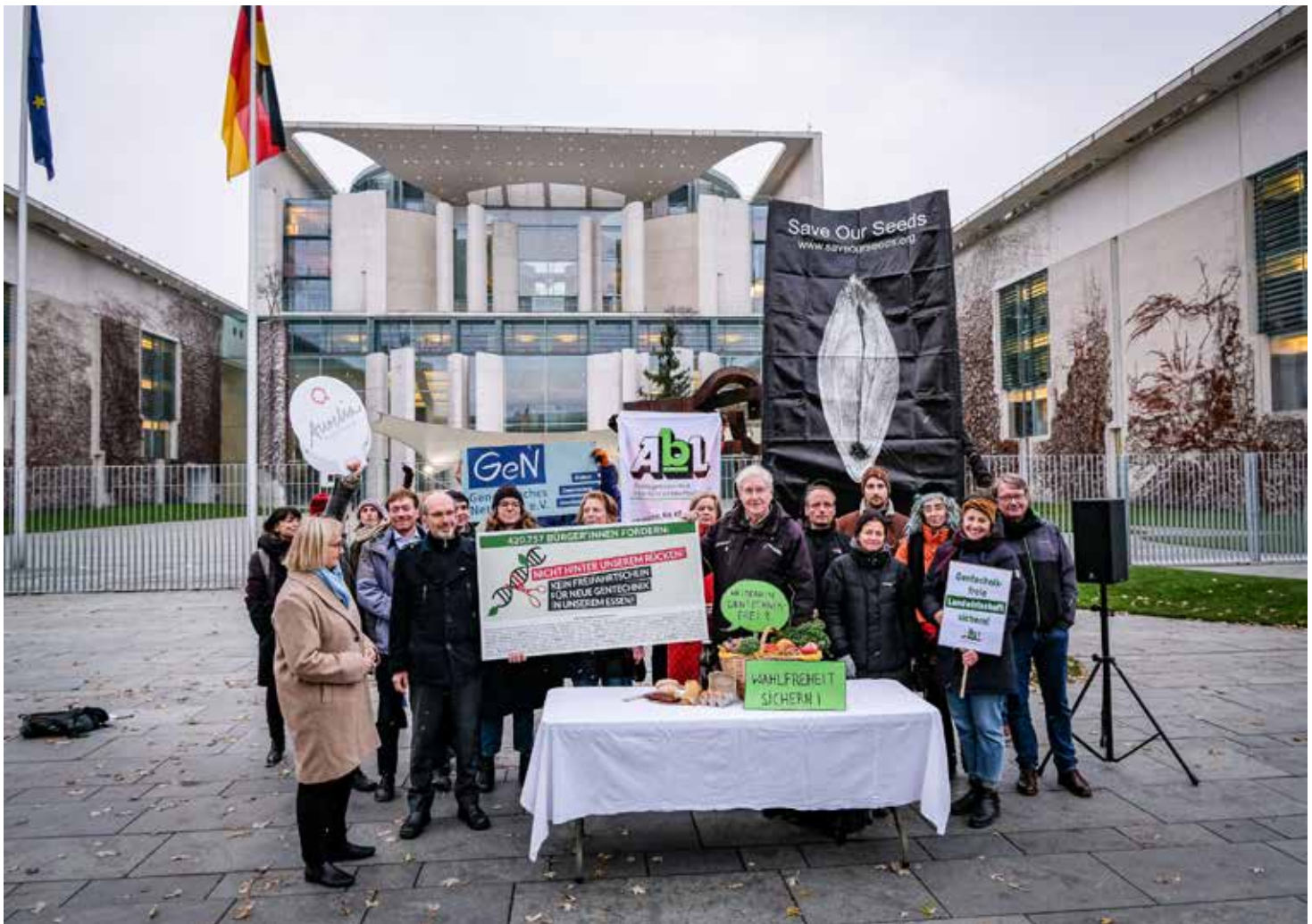
Die Übergabe von 420'000 Unterschriften gegen die Deregulierung der Gentechnik ans Umweltministerium sowie die EU-Kommission blieb folgenlos.